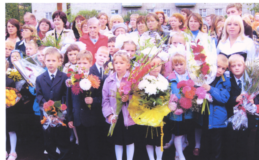
1 сентября 2008 года