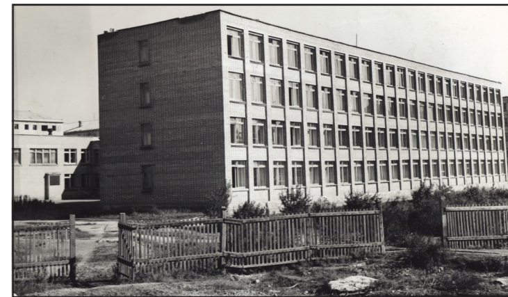
Наша школа 35 лет назад

Когда нам деревья казались большими, И первый учитель встречал, Мы первую в жизни задачу решили: Школа - начало начал.